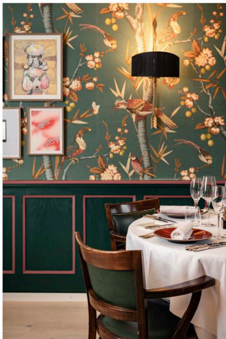
Salle du restaurant Le Vallon à Conches