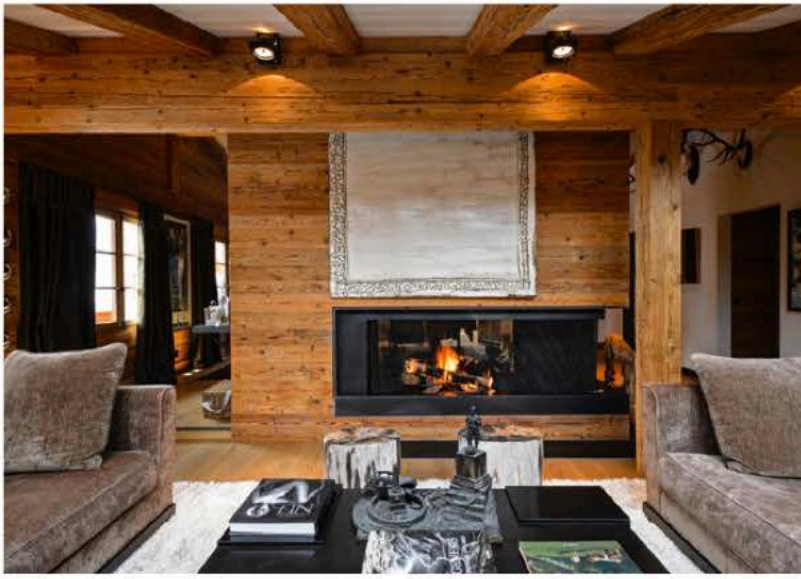
Chalet à Gstaad Œuvre Joan Hernández Pijuan Table en bronze Eric Schmitt

La philosophe du design parle de ses nombreux projets avec beaucoup de modestie au fond. On apprend, en effet, qu'elle fut celle qui a redonné son panache à la propriété de Klein Constantia en Afrique du Sud. Datant de 1685 et décrit comme l'un des plus beaux domaines viticoles au monde, la tâche était titanesque. Il a fallu garder le style architectural afrikaner traditionnel appelé Cape Dutch dans la maison classée tout en apportant une touche contemporaine. L'experte a su garder l'essence des lieux et mettre en valeur les racines de cette maison classée. Un chantier qui a duré une année et qui l'a laissée sur les rotules. Suite à ce mandat, elle décide de trouver des projets locaux, en B2B pour être plus proche de sa fille. « J'ai tellement voyagé durant ma carrière, avec des chantiers aux États-Unis, en Israël et un peu partout en Europe. Je me suis occupée de spa, de restaurants, de chalets, de résidences privées. J'ai travaillé sans relâche tous les week-ends. C'était le moment de me poser enfin à Genève ».