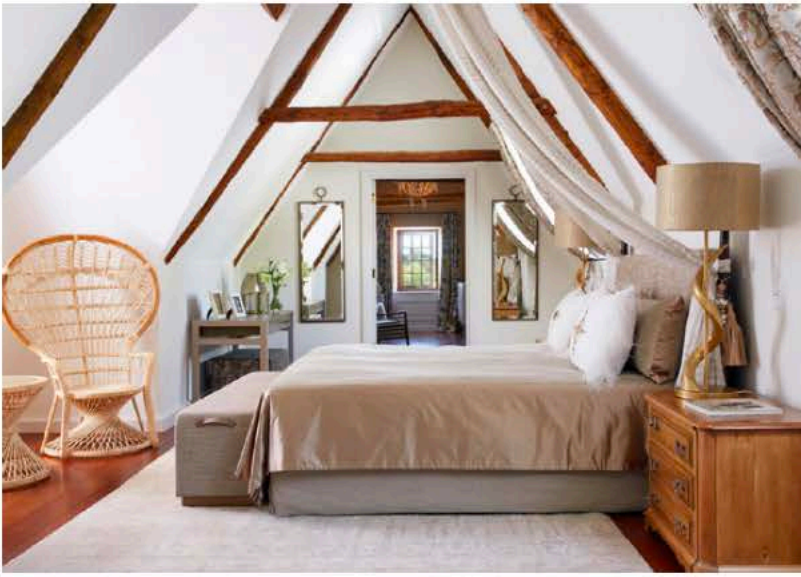
Klein Constantia, Afrique du Sud Tissu Pierre Frey Mobilier fabrication locale Suspensions CTO lighting