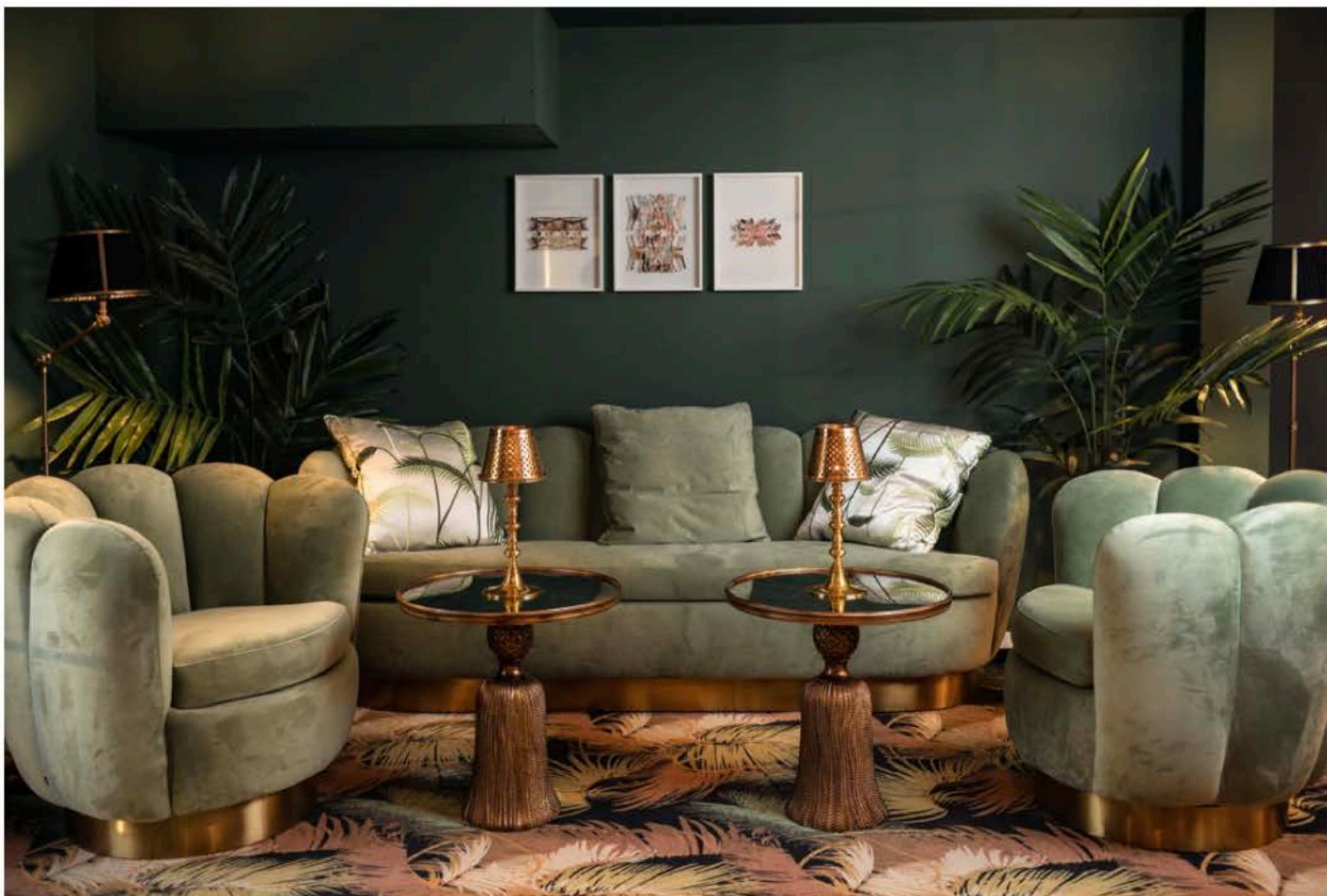
Moquette Pierre Frey par Dimore Studio Peinture Argile, Paris Mobilier Eichholtz Papier peint Nobilis, Joséphine

différentes salles du restaurant, bien que rénovées, ont conservé leur caractère d'authenticité.